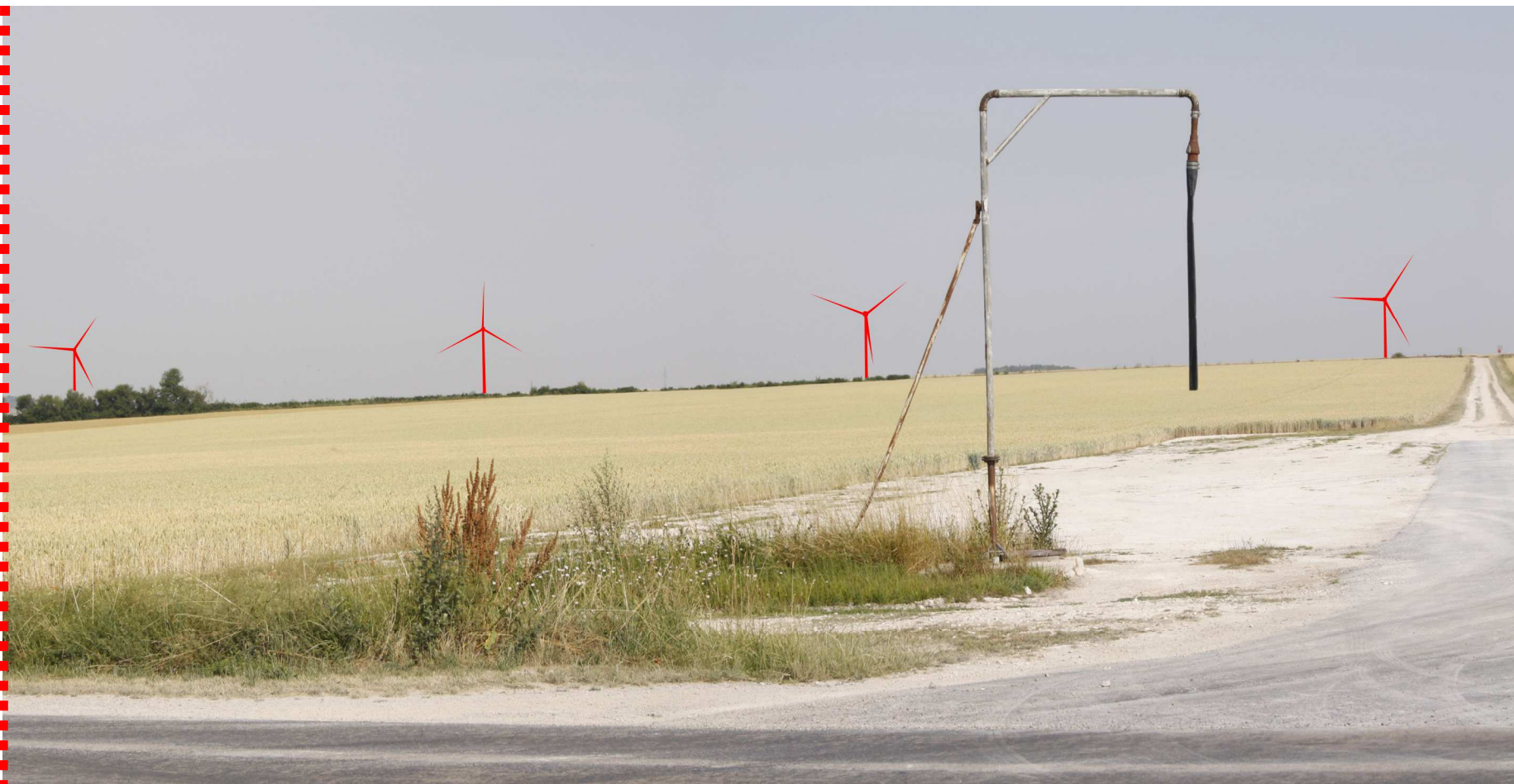
Photomontage d'interprétation recadré à 60°