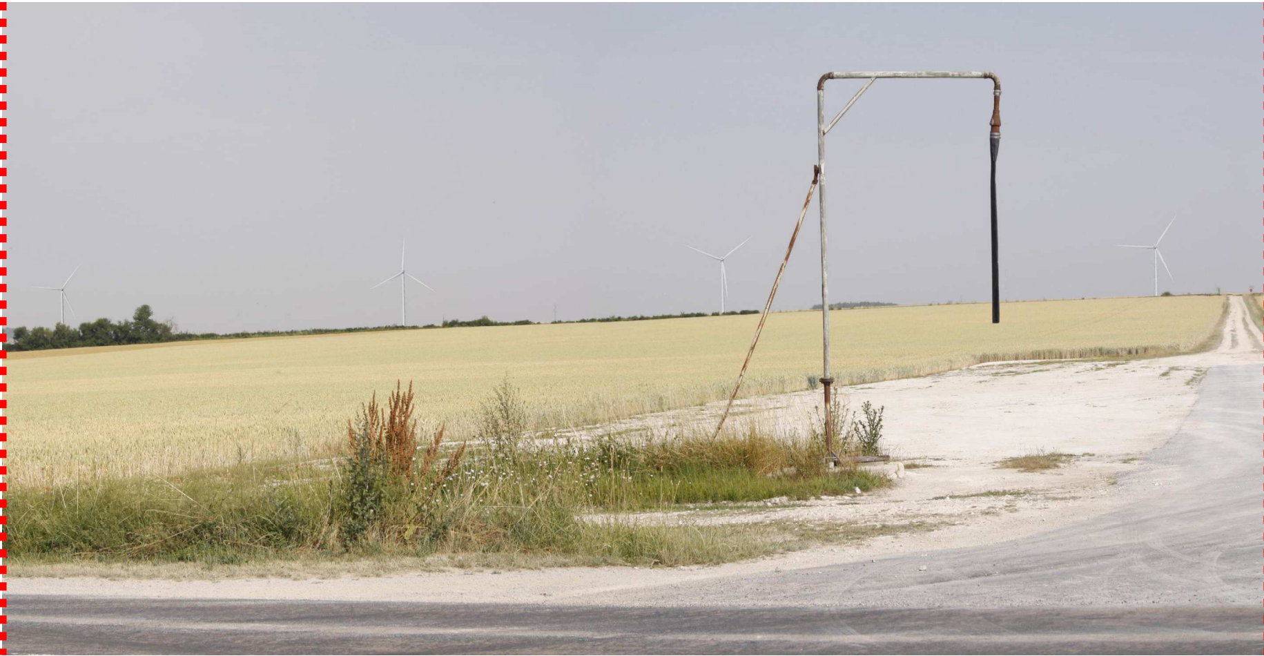
Photomontage recadré à 60°